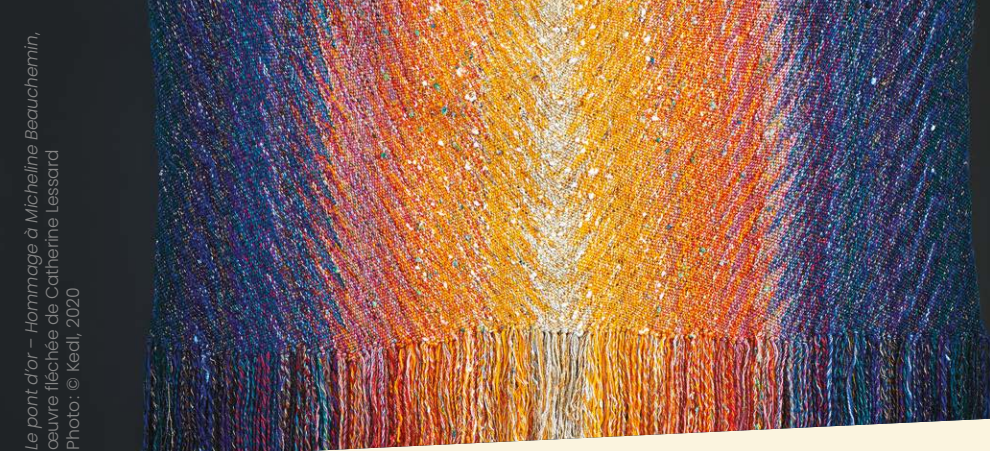
Le pont d'or – Hommage à Micheline Beauchemin, œuvre fléchée de Catherine Lessard